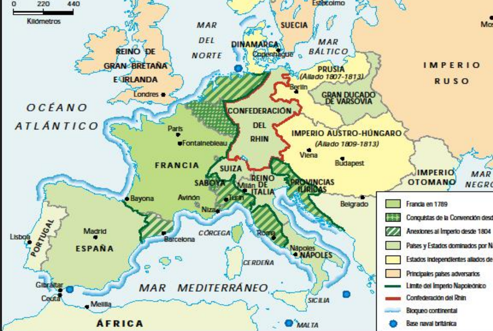
Mapa del Imperio francés en 1812.